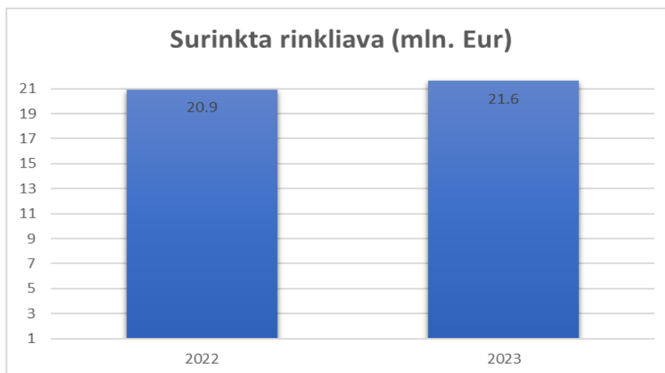
2 pav. Surinkta rinkliava

Šaltinis. Įmonės 2022 metų ir 2023 metų veiklos ataskaitos.